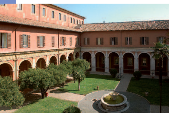
Cortile Angelicum - Roma

Nei limiti dei posti disponibili, la partecipazione al US Corporate Visit Program è aperta anche a coloro che non sono iscritti al Master. In tal caso è prevista una fee di iscrizione al programma a carico del partecipante.