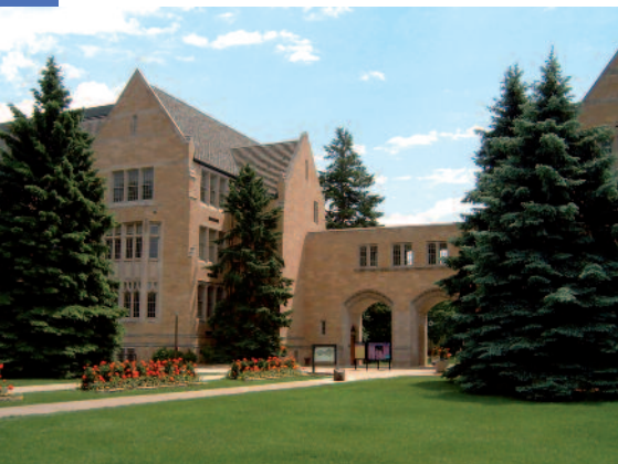
St. Thomas Campus - Minnesota

Nei limiti dei posti e delle risorse disponibili è possibile effettuare stage di durata variabile presso alcune delle Aziende Partner.