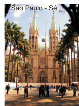
São Paulo - Sé